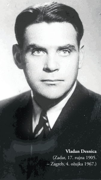
Vladan Desnica (Zadar, 17. rujna 1905. – Zagreb, 4. ožujka 1967.)